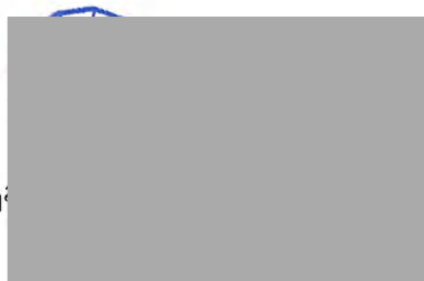
กรรมการผู้มีอำนาจ บริษัท ไดมอนด์ پار্ক จำกัด