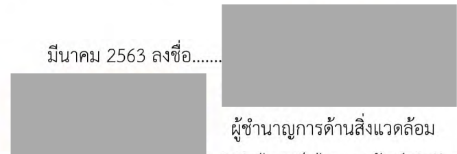
ผู้อำนวยการด้านสิ่งแวดล้อม บริษัท ไทยเอ็นไวรอนเม้นท์ จำกัด